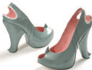
Kobi Levi, „Shark“, Israel 2012

Das Thema „Schuhe“ eröffnet einen ganzen Kosmos von Geschichten, individuellen Erfahrungen und Vorurteilen. Schuhe stehen für Leidenschaft und Fetisch, für Sinnlichkeit und die Suche nach Vollkommenheit.