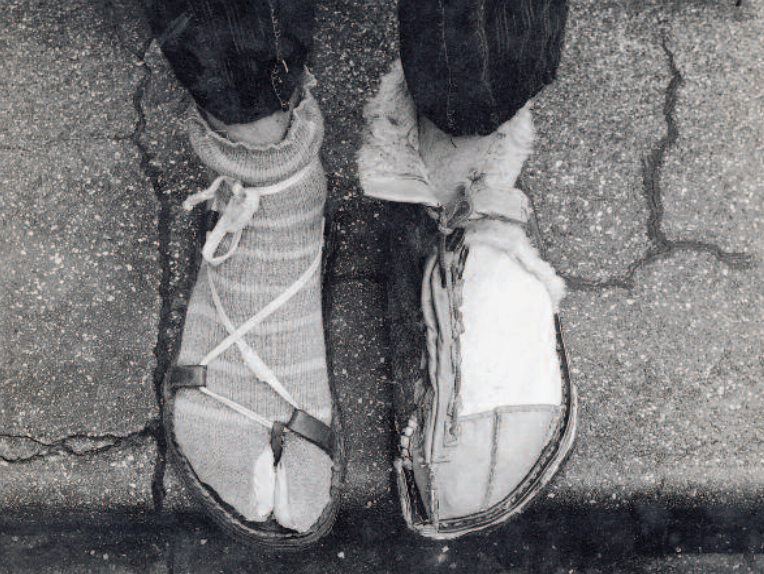
Hundertwassers selbst gemachte Sommer- und Winterschuhe/Hundertwasser's self-made summer and winter shoes, 1954 (Foto in der Ausstellung SHOEtting Stars)