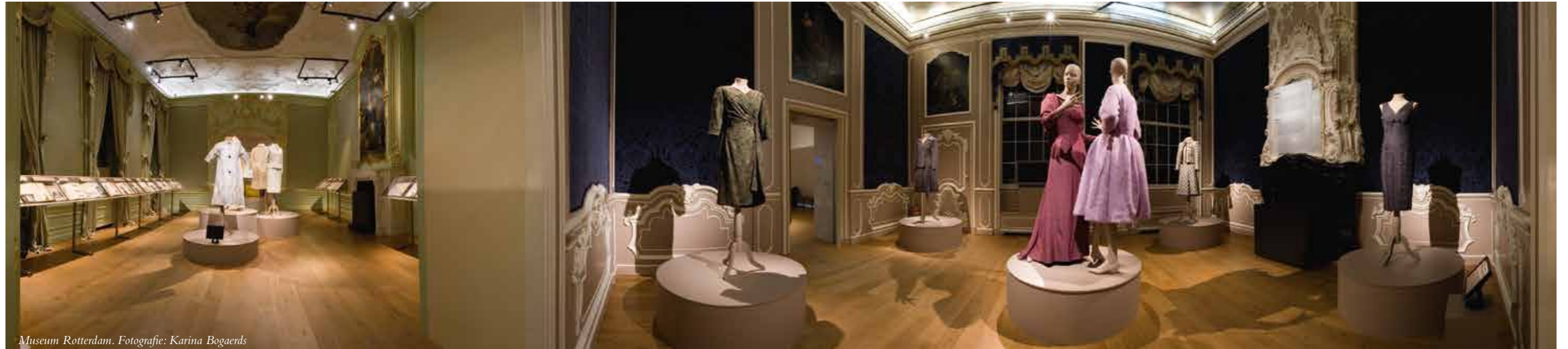
Museum Rotterdam.