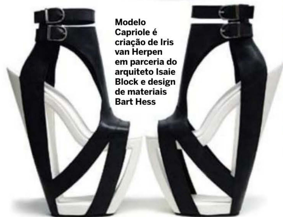
Modelo Capriole é criação de Iris van Herpen em parceria do arquiteto Isaie Block e design de materiais Bart Hess