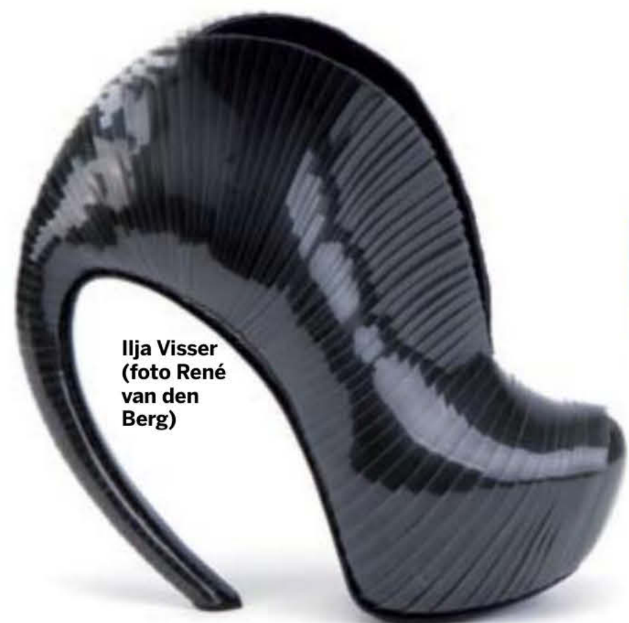
Ilja Visser