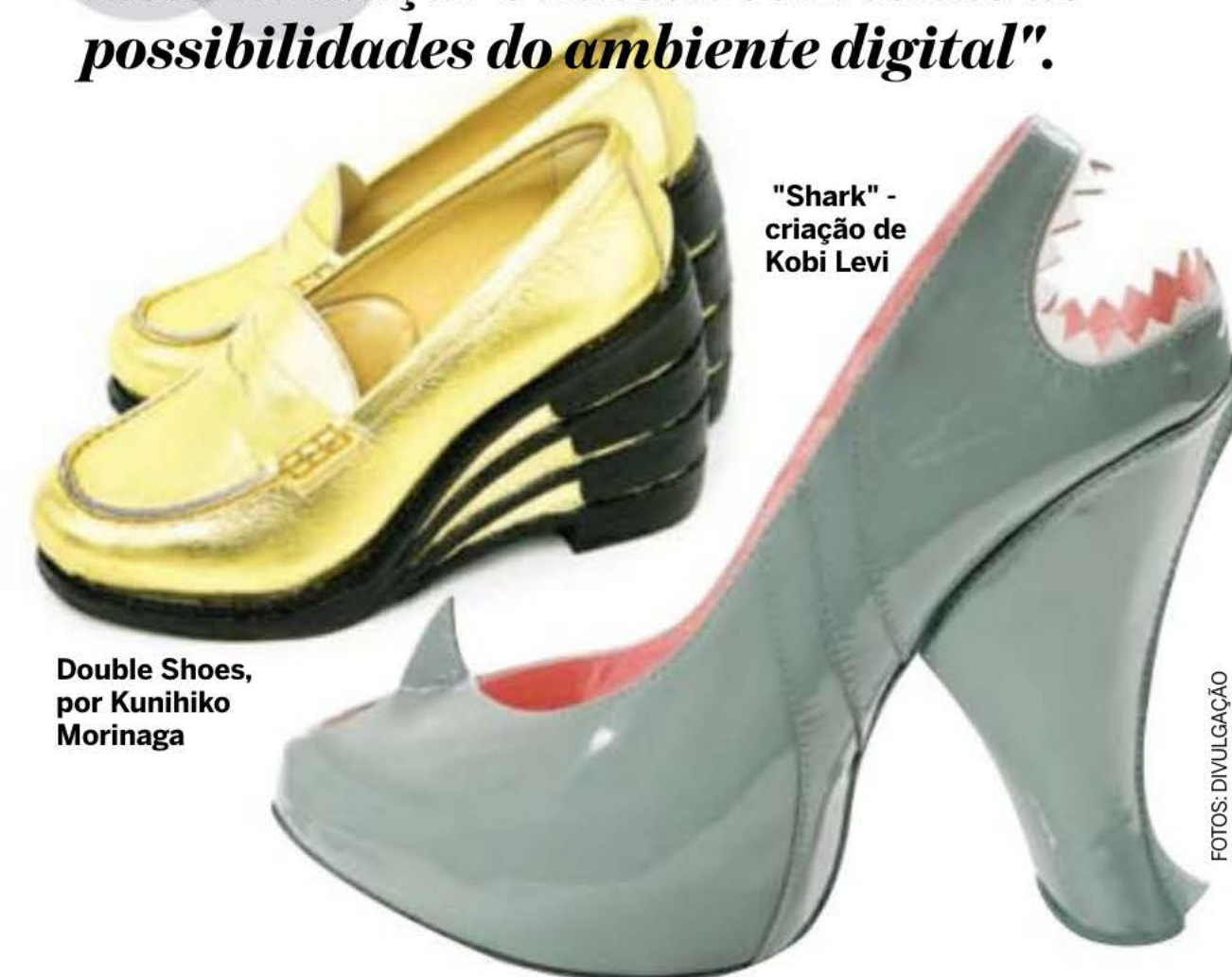
"Shark" - criação de Kobi Levi

Nunca houve um espaço suficiente para mostrar o que coletei. Por isso tive a ideia de lançar o museu com todas as possibilidades do ambiente digital".