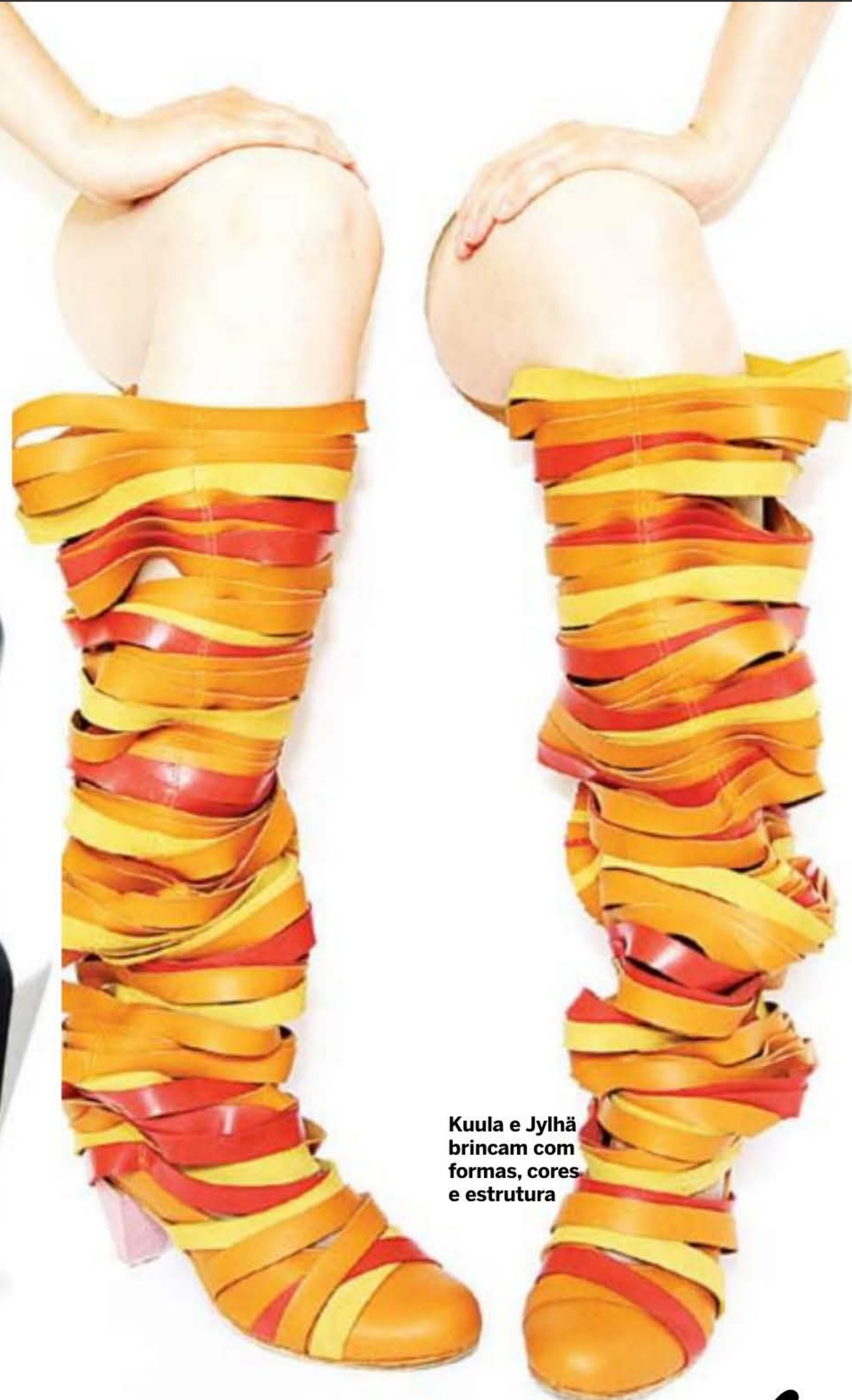
Kuula e Jylhä brincam com formas, cores e estrutura